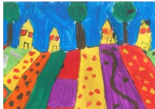
Obrázek namaloval Jirka Nulíček, 3. A

Rád jsem si na rozhovor udělal čas, nemáš zač.