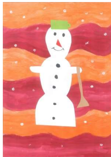
Obrázek namalovala Petra Hasenkopfová, 3. B